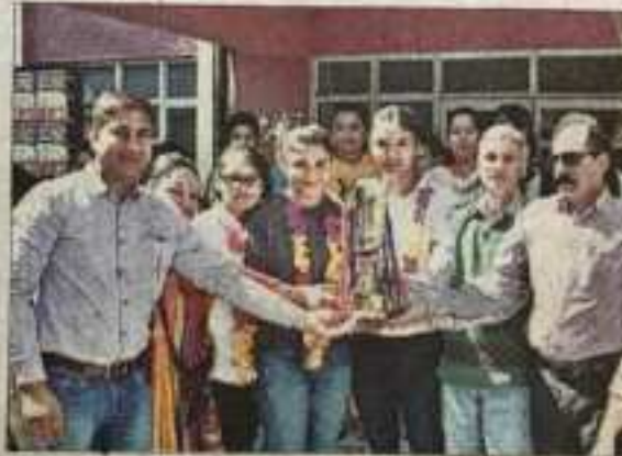
फेस्टिवल में बेहतरीन प्रदर्शन करने वाले छात्रों को स्वागत करता कॉलेज स्टाफ।