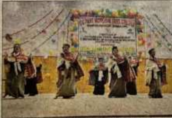
रामपुर कॉलेज में विश्व पर्यटन दिवस पर नाटी पर थिरकती छात्राएं।