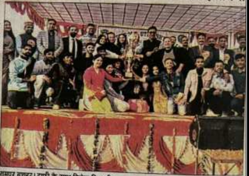
रामपुर बुराहर। ट्राफी के साथ विजेता खिलाड़ी

अंतर महाविद्यालय युवा महोत्सव (गुप-3) में लोक नृत्यकला में राजकीय महाविद्यालय रामपुर बुराहर के विद्यार्थियों ने प्रदेश भर में प्रथम स्थान हासिल कर कालेज का नाम रोशन किया। यह जानकारी देते हुए रामपुर कालेज के प्राचार्य ने बताया कि सिद्धार्थ राजकीय उत्कृष्ट महाविद्यालय नादौन में आयोजित इस तीन दिवसीय कार्यक्रम में प्रदेश भर से 55 महाविद्यालयों के लगभग 1000 विद्यार्थियों ने भाग लिया। गुप-3 के अंतर्गत लोक नृत्य और शास्त्रीय नृत्य कार्यक्रम होते हैं। राजकीय महाविद्यालय रामपुर बुराहर के विद्यार्थियों ने अपने उत्कृष्ट प्रदर्शन से महाविद्यालय का नाम रोशन किया। इस उपलब्धि के लिए महाविद्यालय के प्राचार्य ने विद्यार्थियों और कार्यक्रम प्रभारी को बधाई देते हुए कहा कि महाविद्यालय के छात्र-छात्राएं हर क्षेत्र में उपलब्धियां हासिल कर रहे हैं, यह हम सभी के लिए खुशियों के फल हैं।