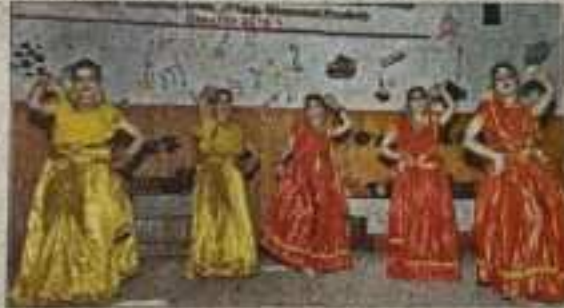
वार्षिक समारोह के दौरान प्रस्तुति देती छात्राएं।

वार्षिक समारोह को सुरुआत छात्राओं ने सरस्वती वंदना से की। इसके बाद छात्र छात्राओं ने विभिन्न रंगारंग कार्यक्रम पेश का खुब सम्भवाया। छात्राओं ने राजस्थानी नृत्य घूमर और झमाकड़ा जिले के पारंपरिक नृत्य झमाकड़ा पर रंगारंग कार्यक्रम पेश कर दर्शकों का धरपूर मनोरंजन किया। कलकत्ता ने पहाड़ी, हिंदी, किन्नोरी, पंजाबी गीतों पर एक से