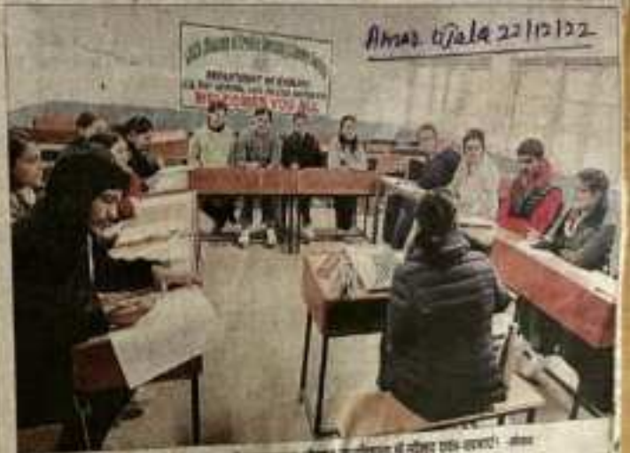
श्री. कॉलेज रामपुर में रचनात्मक लेखन कार्यशाला में सीट पर छात्र-छात्राएँ।