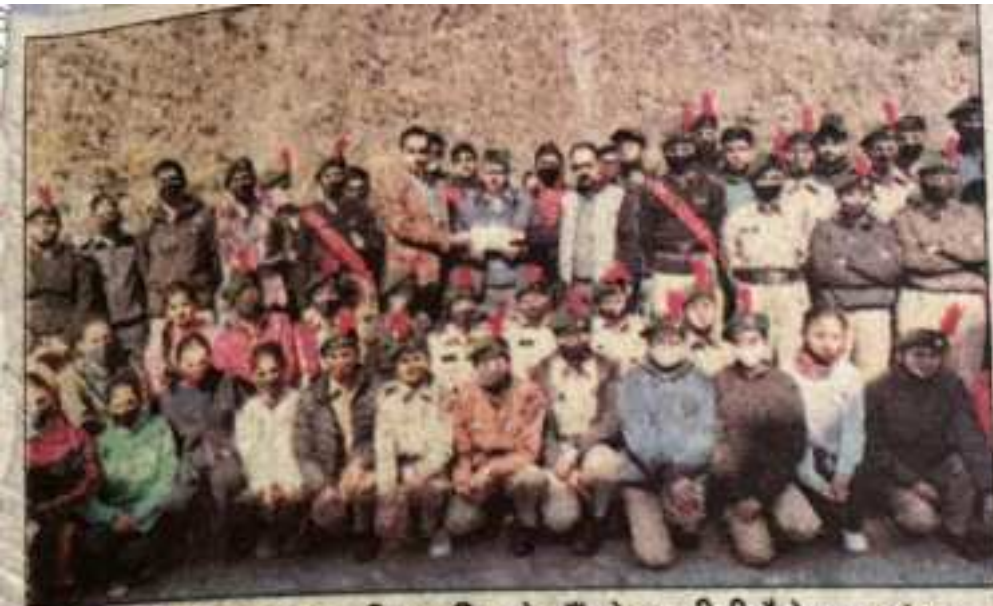
सेना झंडा दिवस पर एकत्रित राशि को सौंपते एनसीसी कैडेट्स। -संवाद