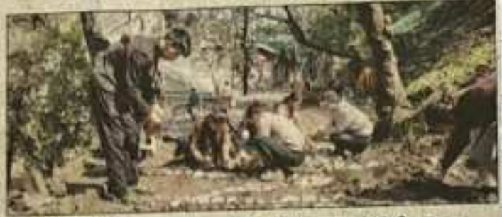
पीजी कॉलेज रामपुर में क्यास्थियों को संवारते स्वयंसेवी संवाद