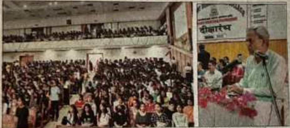
राजकीय कॉलेज रामपुर बुराहर में दीक्षारंभ कार्यक्रम में मौजूद नए छात्र और छात्राएं और संबोधित करते प्राचार्य। -नूज

अनुशासित जीवन शैली अपनाकर नैतिक और सैद्धांतिक मूल्य सामाजिक जीवन में लेकर चले बढ़ें। आज युवा वर्ग नशे से घाटे में डूबा जा रहा है, आप