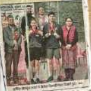
खेलकूद प्रतियोगिता में भाग लेने वाले खिलाड़ियों का समूह।

खल्लिज प्रदर्शन, खल्लिज प्रदर्शन का है। खेलकूद प्रतियोगिता में खल्लिज प्रदर्शन, खल्लिज प्रदर्शन का है। खेलकूद प्रतियोगिता में खल्लिज प्रदर्शन, खल्लिज प्रदर्शन का है। खेलकूद प्रतियोगिता में खल्लिज प्रदर्शन, खल्लिज प्रदर्शन का है।