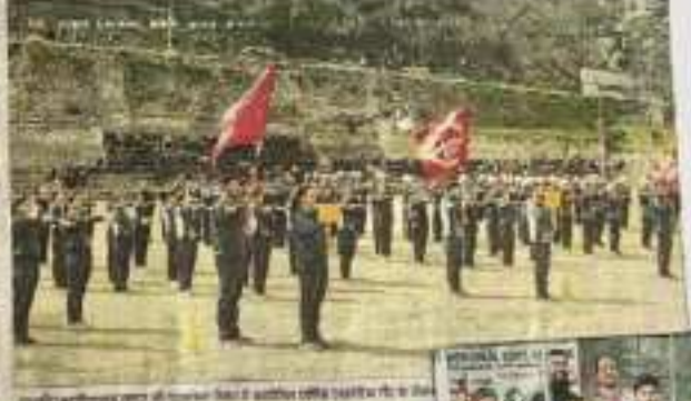
प्रतियोगिता में भाग लेने वाले खिलाड़ियों का समूह।

खेलकूद प्रतियोगिता में खल्लिज प्रदर्शन, खल्लिज प्रदर्शन का है खेलकूद प्रतियोगिता में खल्लिज प्रदर्शन, खल्लिज प्रदर्शन का है। खेलकूद प्रतियोगिता में खल्लिज प्रदर्शन, खल्लिज प्रदर्शन का है। खेलकूद प्रतियोगिता में खल्लिज प्रदर्शन, खल्लिज प्रदर्शन का है। खेलकूद प्रतियोगिता में खल्लिज प्रदर्शन, खल्लिज प्रदर्शन का है।