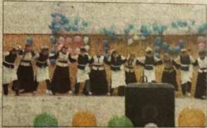
पीजी कॉलेज रामपुर में कार्यक्रम के दौरान प्रस्तुतियां देती छात्राएं। -संवाद

इसमें जनजातीय छात्र और छात्रावास, अभैठकर, छात्रावास और भद्री छात्रावास के सभी छात्र-छात्राओं ने प्रतियोगिताओं में जोर दिखाया। इस अवसर पर भाषण प्रतियोगिता, पोस्टर मेकिंग, रंगोली, लेखन, मेहंदी और लोकनृत्य स्पर्धाएं आयोजित की गईं। मुख्यातिथि ने सभी प्रतिभागियों और विद्यार्थियों को प्रतियोगिताओं में भागीदारी