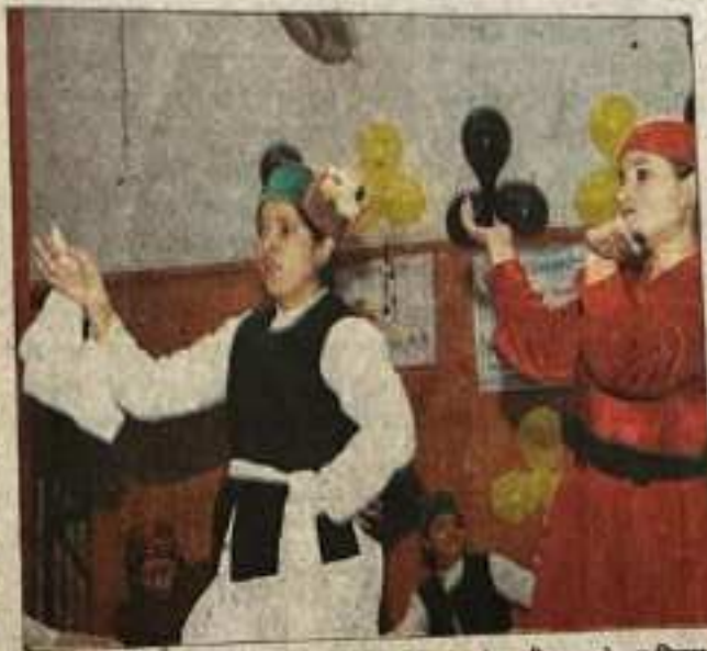
पीजी कॉलेज रामपुर में वाणिज्य विभाग की ओर से राष्ट्रीय उपभोक्ता दिवस पर नाटी के माध्यम से लोगों को जागरूक करती छात्राएं।