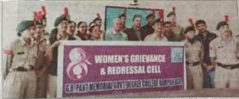
पौजी कॉलेज रामपुर में लैंगिक समानता को लेकर आयोजित कार्यक्रम में मौजूद प्राचार्य और अन्य।