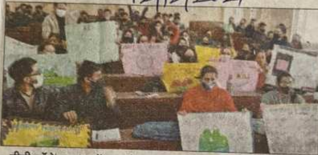
पीजी कॉलेज रामपुर में पहाड़ के महत्व पर प्रकाश डालते विद्यार्थी।